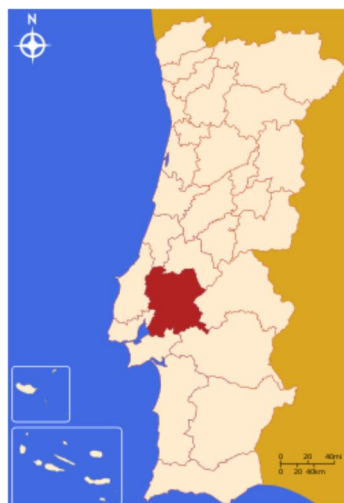
NUTS III Lezíria do Tejo

O município de Santarém, em termos regionais, está integrado na sub-região estatística (NUTS III) da Lezíria do Tejo ocupando uma área de 552,54 Km 2 com uma população de 61 222 habitantes, distribuídos por dezoito freguesias. A Norte faz fronteira com Porto de Mós, Alcanena e Torres Novas; a Sul, com Cartaxo e Almeirim; a Leste, com Golegã, Chamusca e Alpiarça; e a Oeste com Rio Maior e Azambuja. Situado na margem direita do rio Tejo, que o limita a Este.